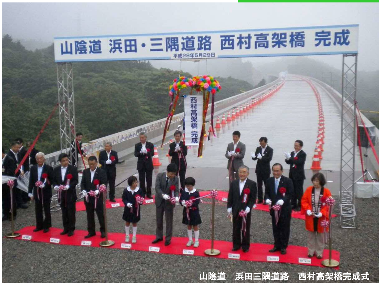
山陰道 浜田三隅道路 西村高架橋完成式