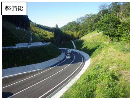
【平成28年2月16日に、一部区間が開通しました!】