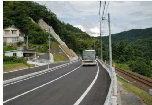
【整備後】大型バスとも離合可能に!!