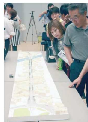
計画案の模型を用いて設計者が説明