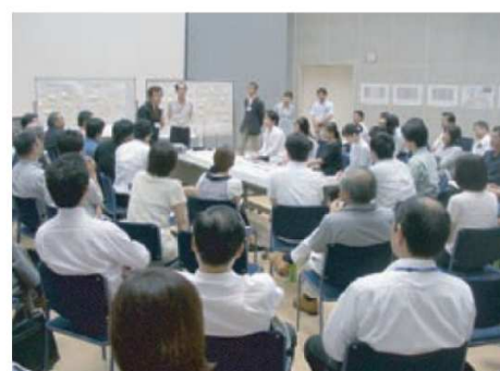
第1回 デザインワークショップの様子

アドレス： http://www.pref.shimane.lg.jp/izumo_kendo/