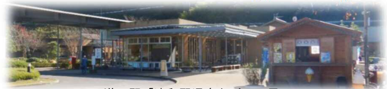
道の駅「津和野温泉 なごみの里」