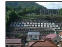
法枠工、アンカー工