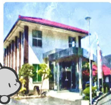
↑会社は掛合にあります。