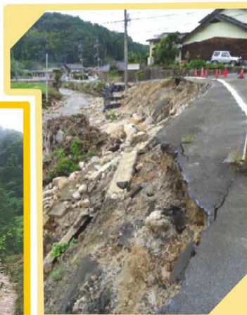
↑3災262号 飯石川 (三刀屋町多久和)