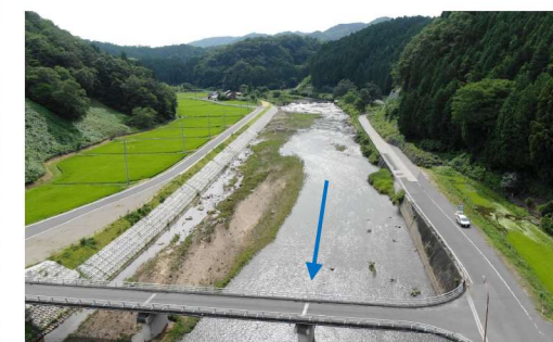
終点付近から中間付近を望む