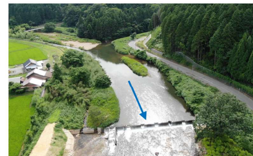
中間付近から起点付近を望む