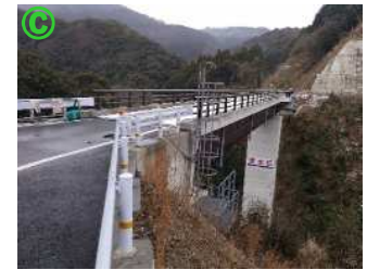
岩瀧寺橋周辺状況