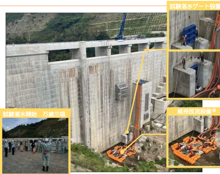
試験湛水開始 万歳三唱