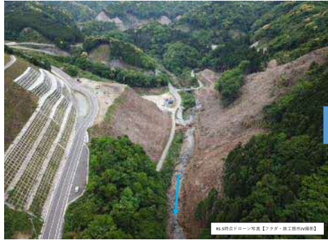
残土処理場のドローン写真【クワダ・施工用内蔵型】

令和元年度は主に基礎掘削工（ダムを施工する場所の土砂や岩盤を取り除く工事）を行います。基礎掘削は火薬使用と機械により行います。掘削した土砂や岩は事業地内の残土処理場へ運搬します。