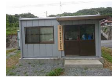
【波積ダム建設事業現場事務所】