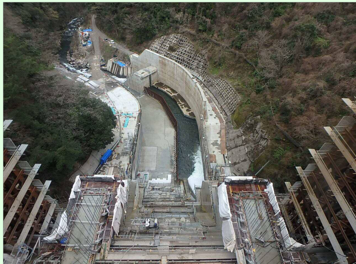
減勢工・工事用道路