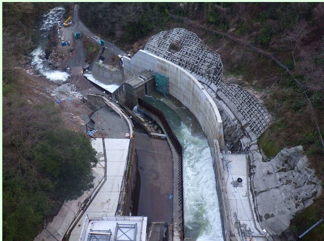
減勢工・工事用道路