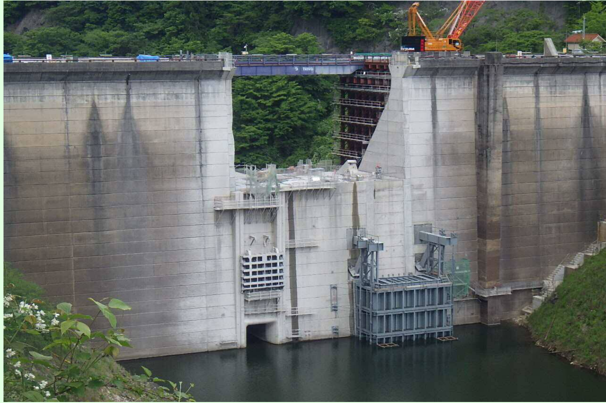
堤頂部既設取壊し及び右岸上流仮締切状況