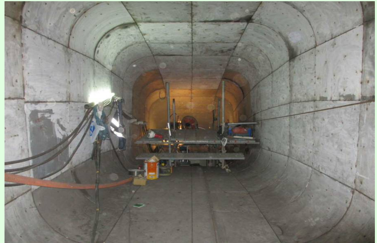
右岸放流管改造状況