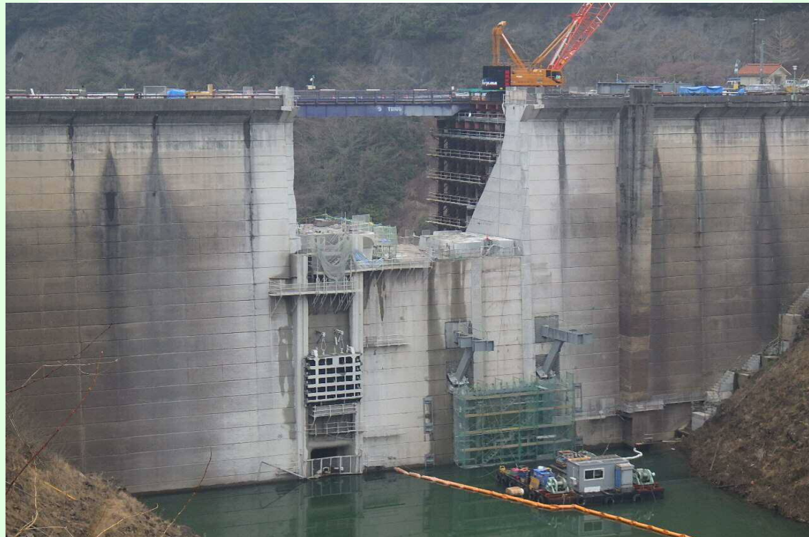
堤頂部既設取壊し及び右岸上流仮締切状況