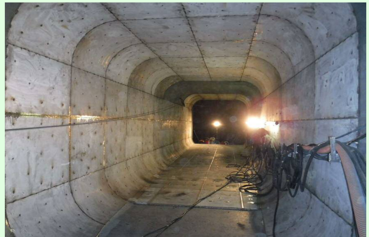
右岸放流管改造状況