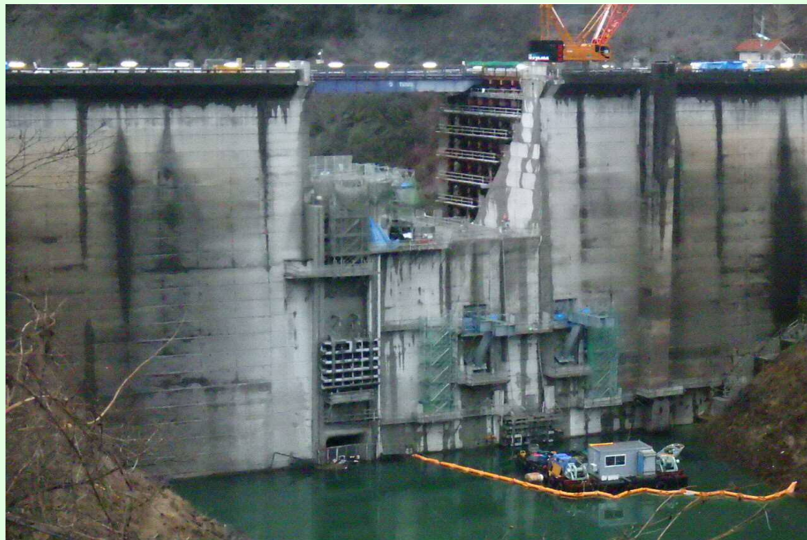
堤頂部既設取壊し及び右岸上流仮締切状況