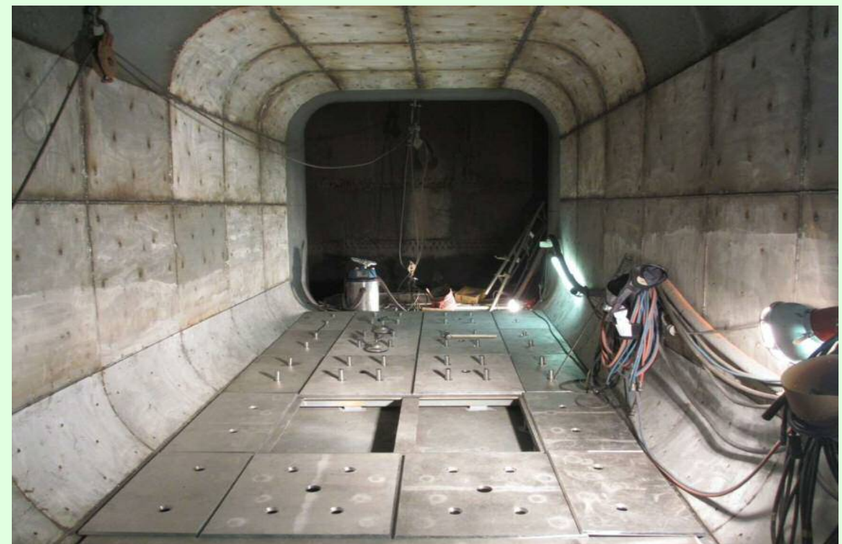
右岸放流管改造状況