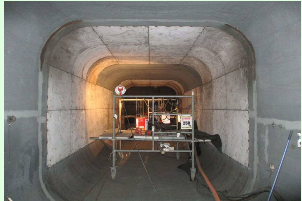
右岸放流管改造状況