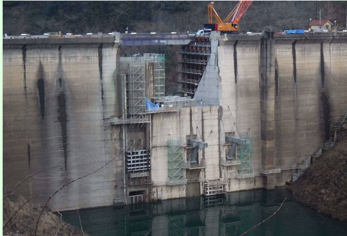
堤頂部既設取壊し及び右岸上流仮締切状況