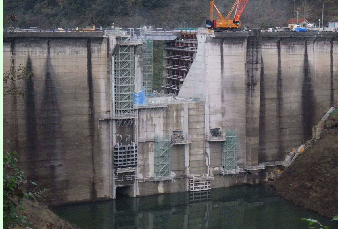
堤頂部既設取壊し状況