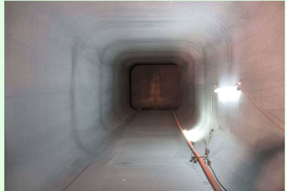
右岸放流管改造状況