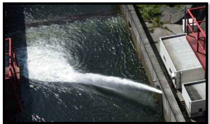
↑維持放流の様子 (現在も実施中です!!)