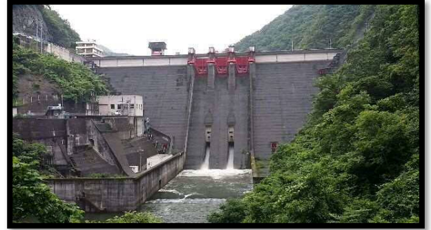
↑【過去の放流の様子】