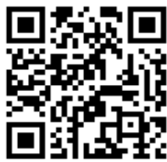
スマートフォン用 QRコード