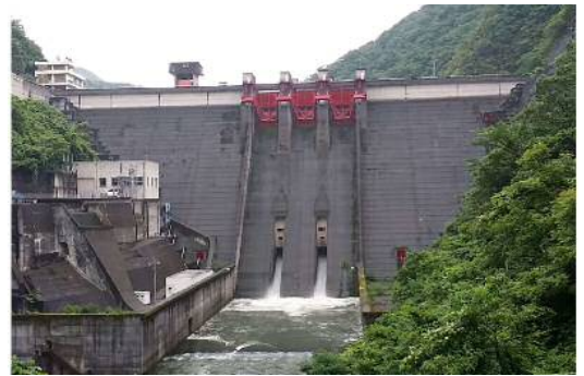
放流中の八戸ダム