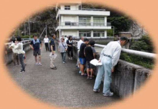
過去の見学の様子

当面の間県の取り組みにより中止していますが、ダムだよりの発行により、ダムの情報について発信していきます。