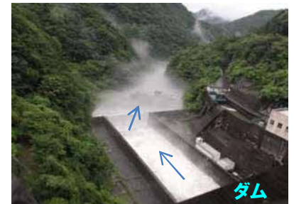
ダムからの放流状況 (7月7日)