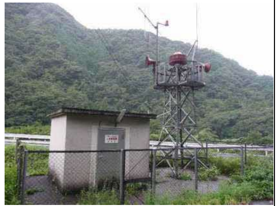
けいほうきょく 警報局