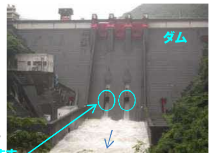
ダムからの放流状況 (7月7日)