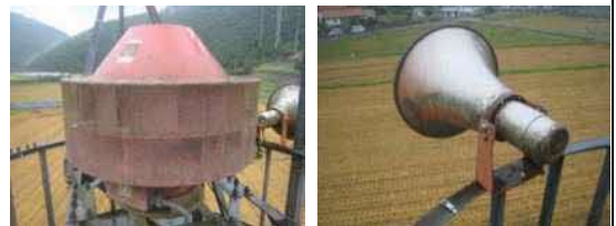
ふる 古くなったサイレン、スピーカー