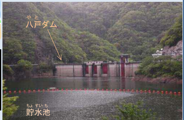
げんざい じょうきょう 現在のダム状況 (5月)