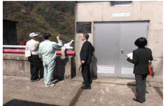
てんばじょうきょう ダム天端状況