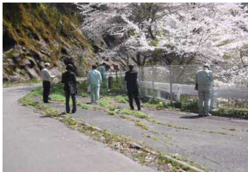
しゅうへんじょうきょう ダム周辺状況