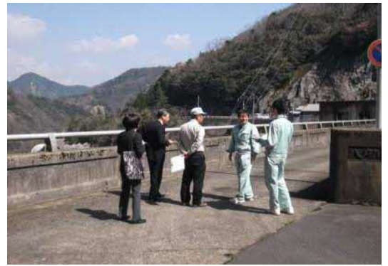
てんばじょうきょう ダム天端状況

これはダム見学に来られる方が、安全で快適に見学をしていただくための点検です。今年は、江津市役所、江津市教育委員会の皆さんと、ダム職員で点検を行いました。改善点は、毎年少しずつ改善し安全確保に努めていきます。