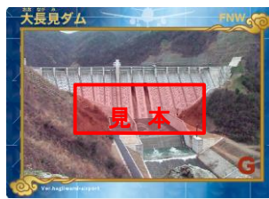
※萩・石見空港限定ダムカード