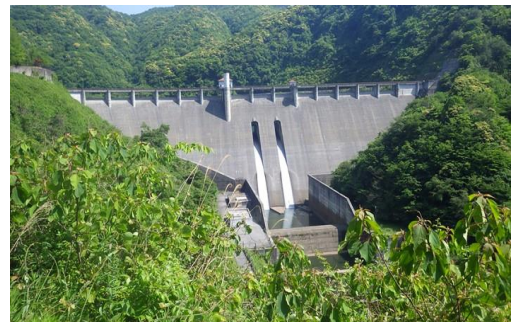
※常用洪水吐から水が流れる様子

ダムでは、大雨洪水警報発令時などは、「洪水警戒体制」として職員が大長見ダム管理所に詰め、ダムの監視や関係機関への情報伝達等を行っています。