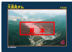
※通常のダムカード