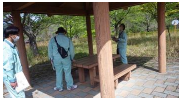
安全利用点検の様子

今後も利用される方々が安心・安全に利用できるよう、危険な箇所があれば随時対策をとり、居心地のよい空間作りを心がけていきます。