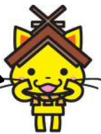
島根県観光キャラクター「しまねっこ」 島観連許諾第6225号