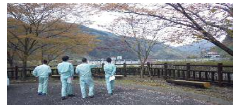
安全利用点検の様子

毎年GW前にダム施設の利用者が増えると想定し、ダム公園等を安全に利用してもらうために柵やベンチ等の点検を行っています。例年、浜田市や地元の自治会と共同で点検を行っていましたが、今年はコロナウイルスの影響で浜田県土整備事務所職員のみでの点検となりました。いつ終息するかは不明で不安が募る中ですが、この状況が落ち着いたらぜひ大長見ダムに遊びに来てください！