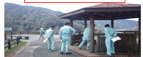
裏面もご覧ください