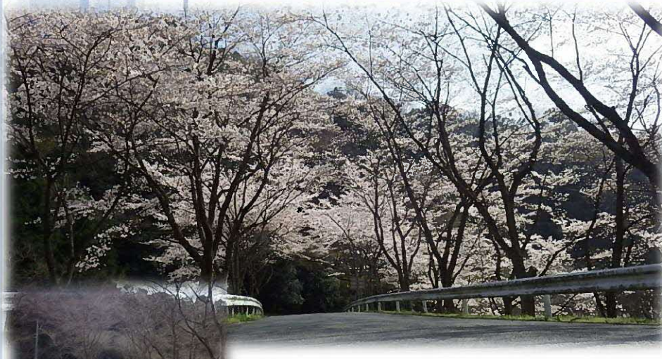
昨年春の桜の小路（写真上）と冬の桜の小路（写真左）

もうすぐ春ですね。春といえば桜、今回はドライブスルーで気軽に見れる桜の名所を紹介します。