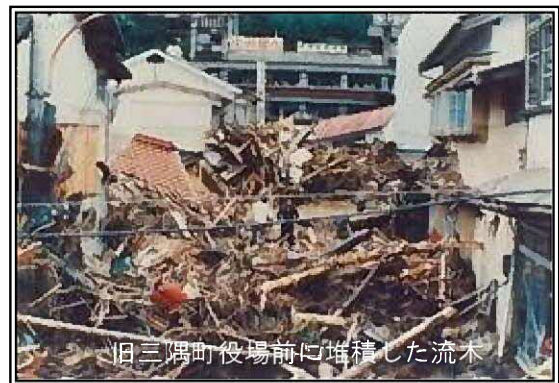
旧三隅町役場前に堆積した流木