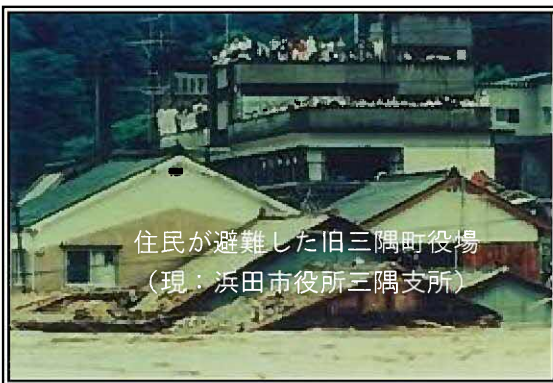
住民が避難した旧三隅町役場 (現：浜田市役所三隅支所)

昭和58年7月豪雨は、100年確立規模の日雨量365mmという記録的な豪雨で、旧三隅町は濁流と流木に呑み込まれ、壊滅的な被害を受けました。