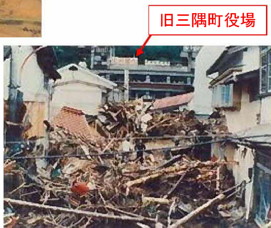
旧三隅町役場前に堆積した流木

島根県浜田県土整備事務所 〒697-0041 島根県浜田市片庭町254 TEL. 0855-29-5678