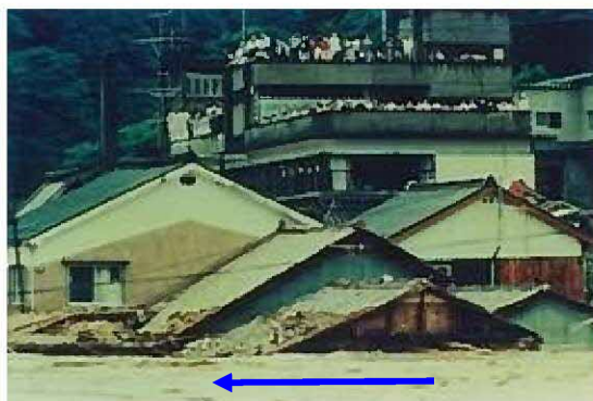
住民が避難した旧三隅町役場

昭和58年7月豪雨は、100年確率規模の日雨量365mmという記録的な豪雨で、旧三隅町は濁流と流木に呑み込まれ、壊滅的な被害を受けました。