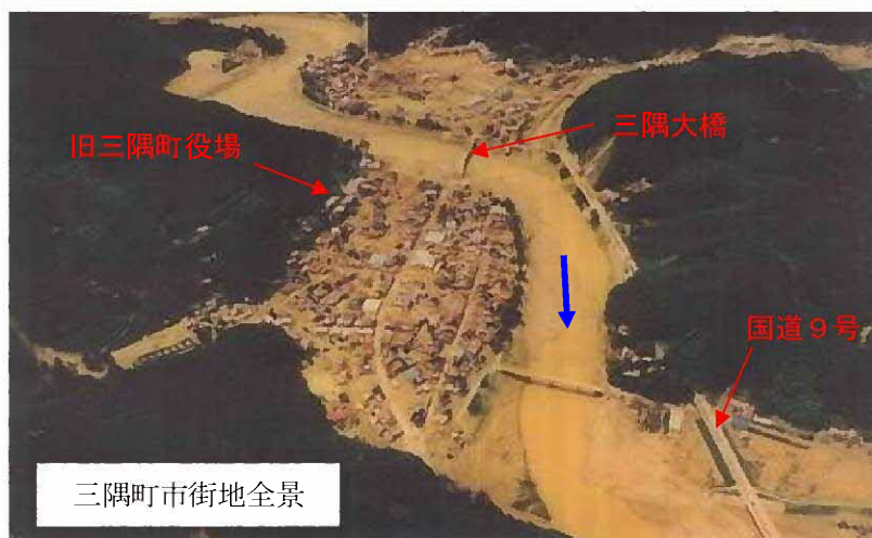
三隅町市街地全景

昭和58年7月豪雨は、100年確率規模の日雨量365mmという記録的な豪雨で、旧三隅町は濁流と流木に呑み込まれ、壊滅的な被害を受けました。