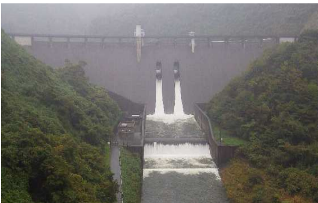
ダムからの出水状況