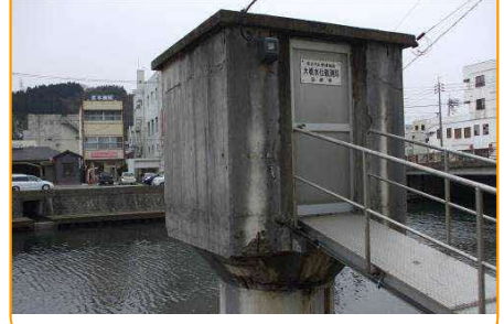
水位局（大橋水位局）

河川に現在どのくらい水が流れているかを観測しています。浜田大橋・中芝橋の近くにあるほか、金城町にもあります。