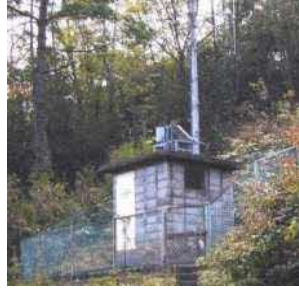
雨量局（嵩山雨量局）

河川に現在どのくらい水が流れているかを観測しています。浜田大橋・中芝橋の近くにあるほか、金城町にもあります。