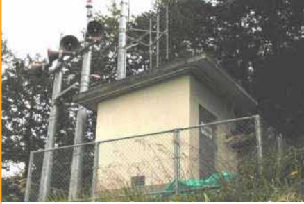
警報局（黒川警報局）

ダムの上流にあります。降雨量を観測し、ダムに流入する水の量を予測するのに活躍します。浜田ダム地点のほかに3ヶ所あります。