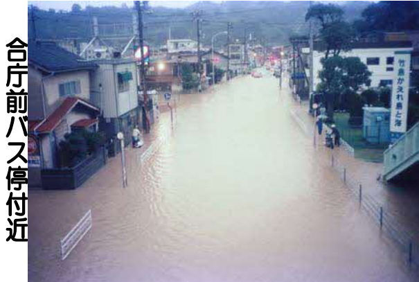
合庁前バス停付近