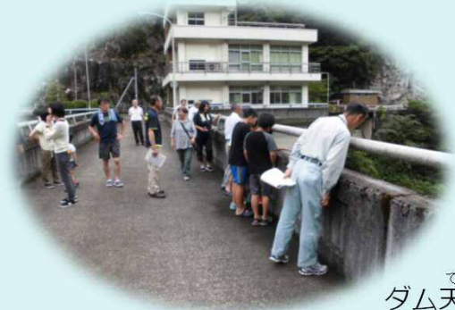
てんばけんがく ダム天端見学