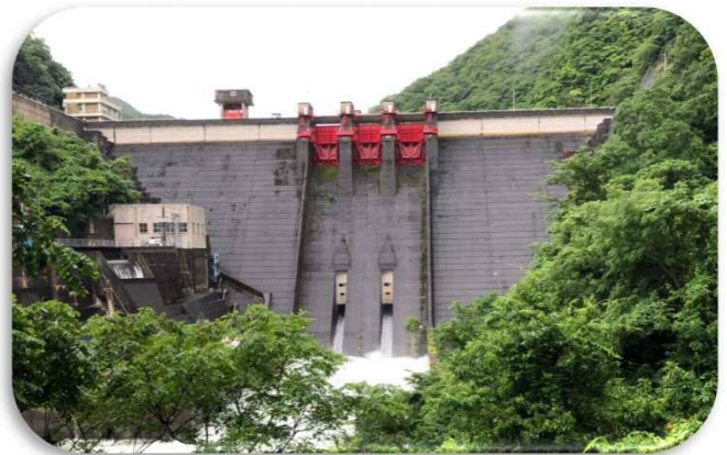
ダム放流時の様子