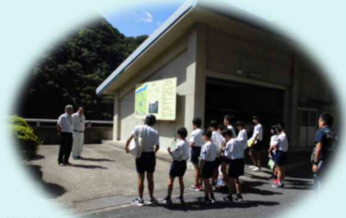
がいようせつめい ダム概要説明

こうよう きれい じき これから紅葉も綺麗な時期となりますので、 あし はこ おも またダムに足を運んでいただけたらと思います。