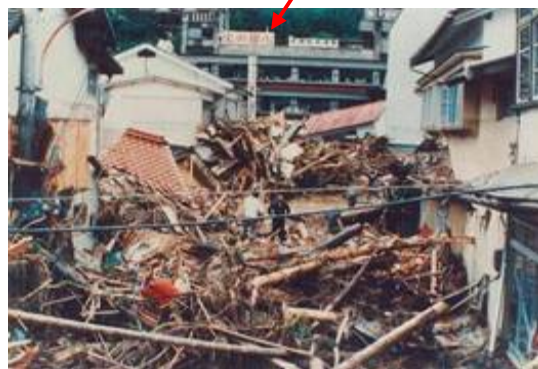
旧三隅町役場前に堆積した流木

島根県浜田県土整備事務所 〒697-0041 島根県浜田市片庭町254 TEL. 0855-29-5678