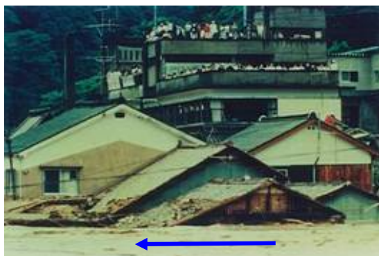
住民が避難した旧三隅町役場 (現：浜田市役所三隅支所)

昭和58年7月豪雨は、100年確率規模の日雨量365mmという記録的な豪雨で、旧三隅町は濁流と流木に呑み込まれ、壊滅的な被害を受けました。