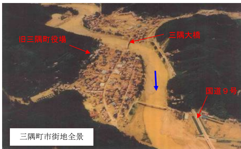
三隅町市街地全景

昭和58年7月豪雨は、100年確率規模の日雨量365mmという記録的な豪雨で、旧三隅町は濁流と流木に呑み込まれ、壊滅的な被害を受けました。