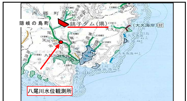
所在地: 島根県隠岐郡隠岐の島町原田 放流状況