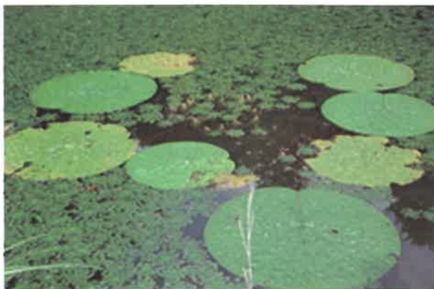
島根県指定希少野生動物植物 オニバス

ます。ここ100年間の生きものの絶滅のスピードは、それまでの1000倍と言われています。