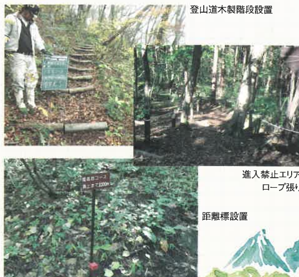
登山道木製階段設置

また、男三瓶頂上までの残り距離を示した距離標を100m毎に設置しました。登山ペース配分のご参考にしてください。