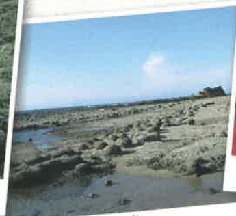
はまだ かいがん 浜田海岸 (浜田市)