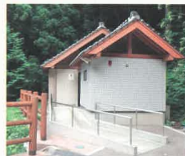
中谷駐車場 公衆トイレ

このように隠岐世界ジオパークでは、利用者にとって快適で環境に優しい施設となるように整備を進めています。