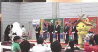
ジオパークフェスタテーブルカット