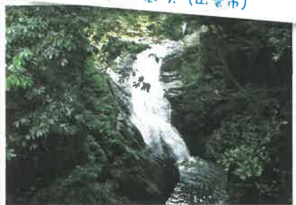
せんぢゆう けい 千丈溪 (江津市・邑南町)