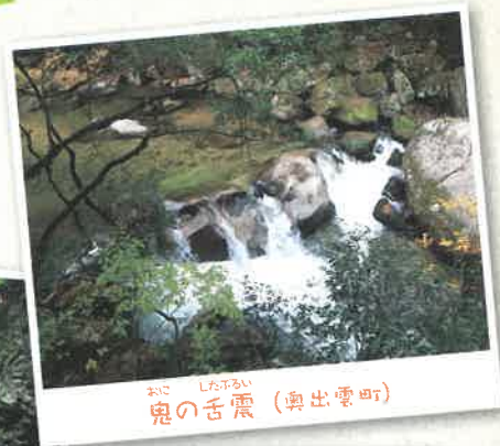
おに したふるい 鬼の舌震 (南出雲町)