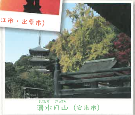
しみず がつざん 清水月山 (安来市)