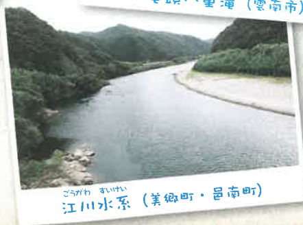
さがみ けいすい 江川水系 (美郷町・邑南町)