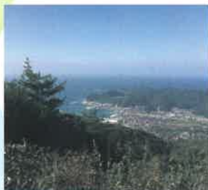
朝日山からの眺望

宍道湖の北側を東西に走る島根半島の北山山系からは、眼下に島根半島の海岸美、遠くに中海・宍道湖さらには大山を一望することができます。また、天気の良い日には隠岐諸島を見ることもできます。