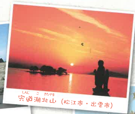
しんどう きたやま 宗道湖北山 (松江市・出雲市)