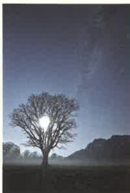
「夢の縁へ」大西浩次

星空と、そんな夜の景色と一緒に写し込んだ天体写真を星景写真と呼んでおり、近年人気が高まってきました。薄明かりに照らされた山脈を覆う天の川、光あふれる都会の空でけなげにきらめく星座。星景写真は、そこにある自然や人々の生活が見えてくる芸術作品とも言えます。