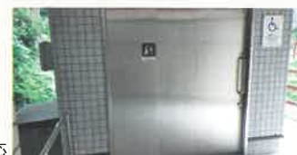
トイレのバリアフリー化対応