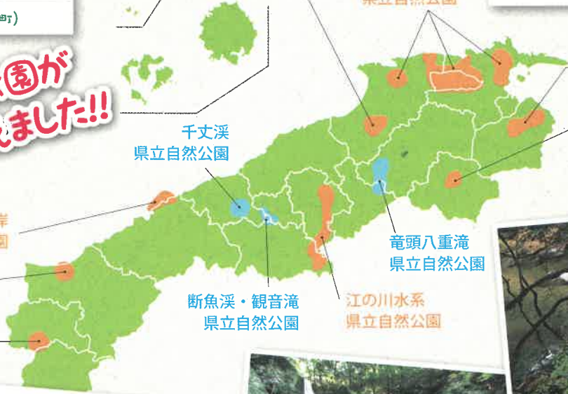
立久恵峽 県立自然公園