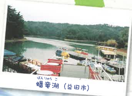
ばんりゅうこ 蟠竜湖 (益田市)