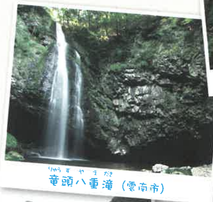
りゅうず ちやうやま 竜頭八重滝 (雲南市)