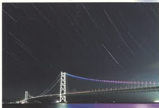
「明石海峡大橋」東山正宜