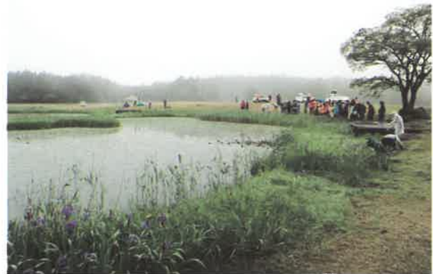
三瓶北の原 姫逃池

私たちは、このような生物多様性の恵みー生態系サービスの中で生活し、その恵みを確保するために森林の手入れや海や川を汚さないように自然を大切にしてきました。