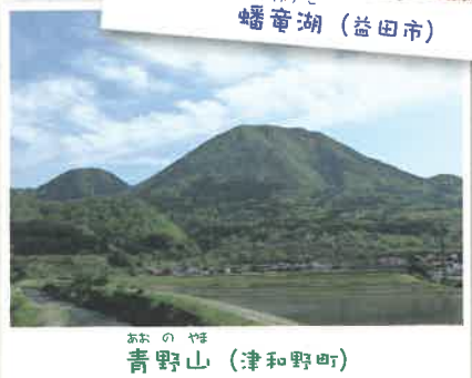
あおの やま 青野山 (津和野町)