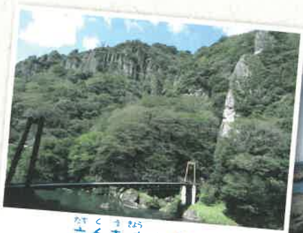
たたくまゑの 立久恵峽 (出雲市)