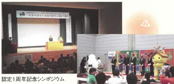
認定1周年記念シンポジウム

世界ジオパーク認定から一年半、推進体制を更に充実させ新たな隠岐世界ジオパークの取り組みが始まります。