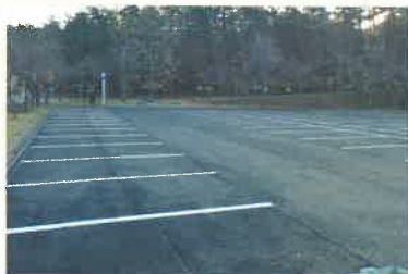
アスル合材を用いた舗装（サヒメル第一駐車場）

三瓶自然館サヒメル本館横の駐車場は、平成3年度に整備され約23年が経過し舗装面の均平性が悪くなり、水溜による利用者へ悪影響の軽減や除雪作業時の不便性を解消