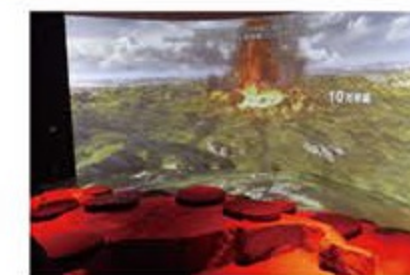
火山時空シアター

国立公園三瓶山にいだかれた自然系博物館。三瓶山と島根の自然を学ぶことができます。また、本格的な天文台とプラネタリウムを備え、満天の星を体験できます。令和2年6月にリニューアルオープンし、五感で楽しむキッズスペースや、大迫力の音と映像の火山時空シアターがオススメです。