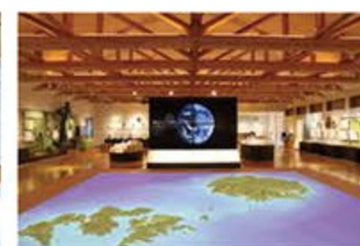
プロジェクションマッピング