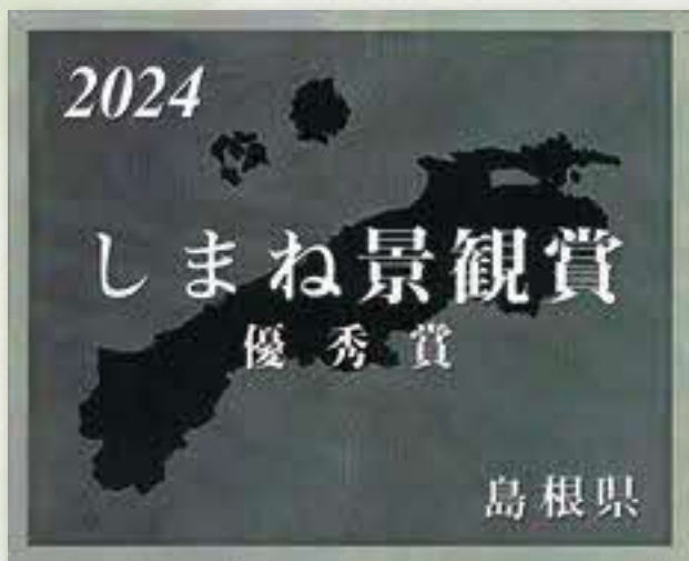
しまね景観賞表彰銘板