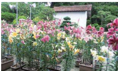
くりまゆり (雲南市大東町西阿用)