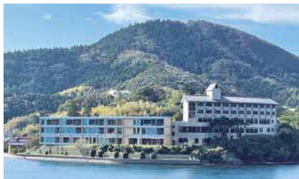
Entô（隠岐郡海士町福井）