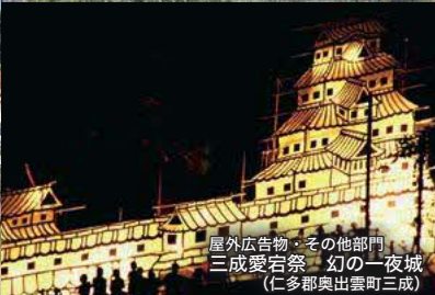
屋外広告物・その他部門 三成愛宕祭 幻の一夜城 (仁多郡奥出雲町三成)