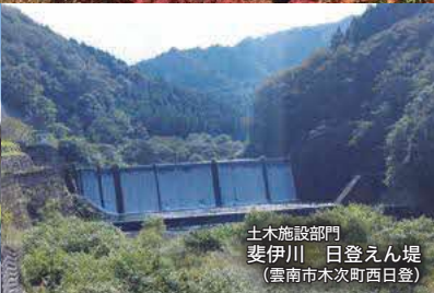
土木施設部門 斐伊川 日登えん堤 (雲南市木次町西日登)