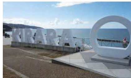
KIRARAモニュメント（出雲市多伎町多岐）