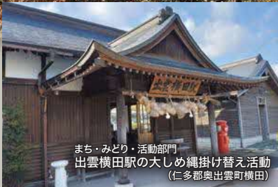
まち・みどり・活動部門 出雲横田駅の大しめ縄掛け替え活動 (仁多郡奥出雲町横田)