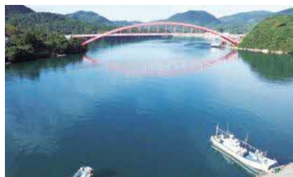
西郷大橋 (隠岐郡隠岐の島町岬町~西西)