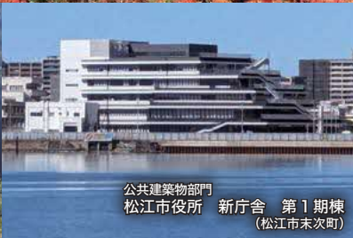
公共建築物部門 松江市役所 新庁舎 第1期棟 (松江市末次町)