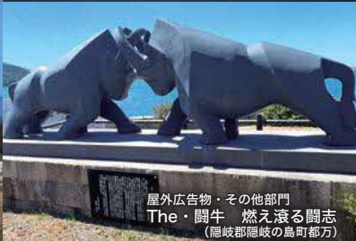
屋外広告物・その他部門 The・闘牛 燃え滾る闘志 (隠岐郡隠岐の島町郡方)