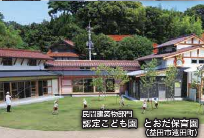
民間建築物部門 認定こども園 とおだ保育園 (益田市遠田町)