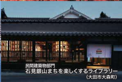
民間建築物部門 石見銀山まちを楽しくするライブラリー (大田市大森町)