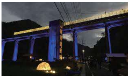
宇都井駅公園 (邑智郡邑南町宇都井)