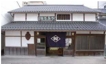
加島茶舗（松江市西茶町）