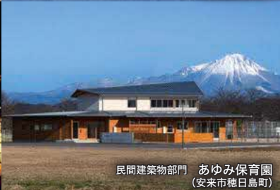
民間建築物部門 あゆみ保育園 (安来市穂日島町)