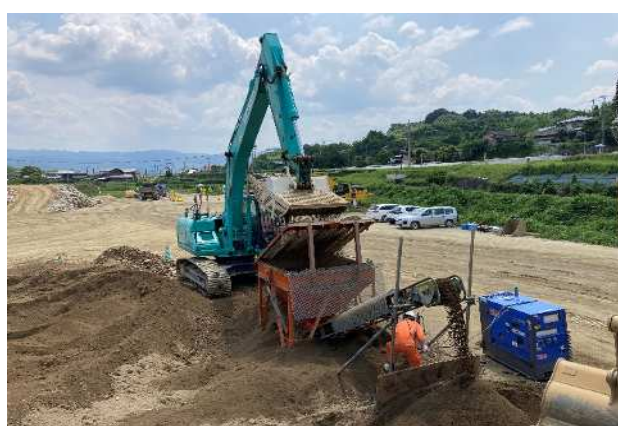
災害発生土による吹付用土砂製造