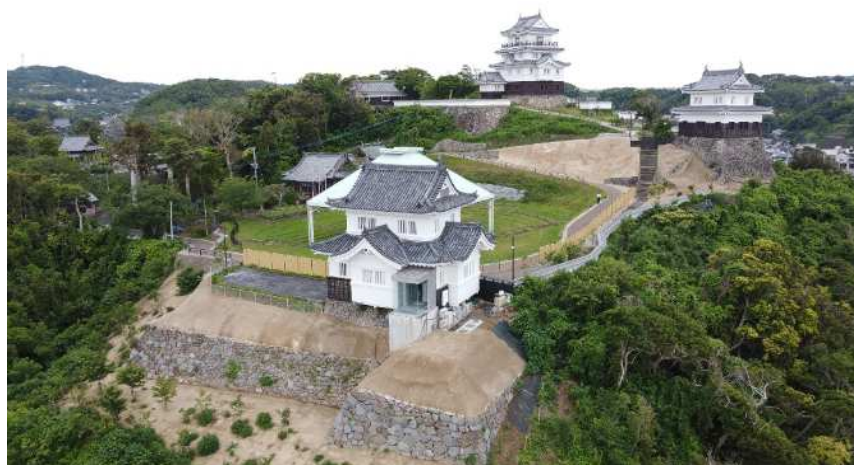
【平戸城 遠景 R4・R5施工】