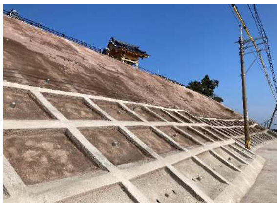
【乾式による吹付作業】