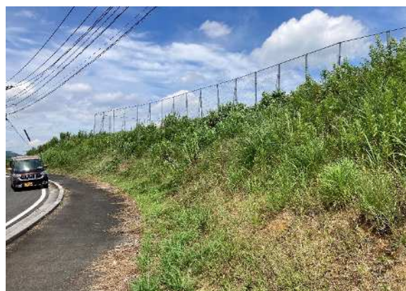
【現地調査時全景 植物の繁茂】