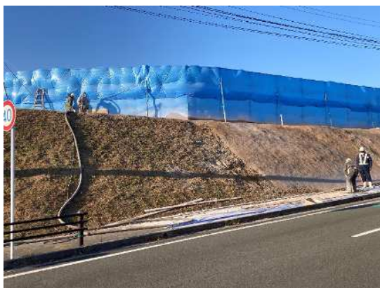
【除草・法面清掃後、ラス無しにより吹付】