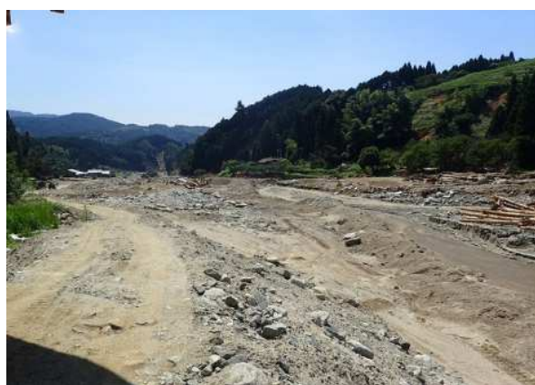
平成29年 九州北部豪雨により被災