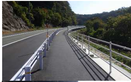
終点側(三刀屋方面より撮影)