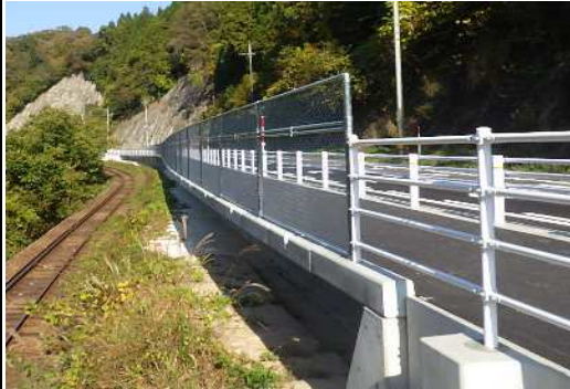
起点側(横田方面より撮影)