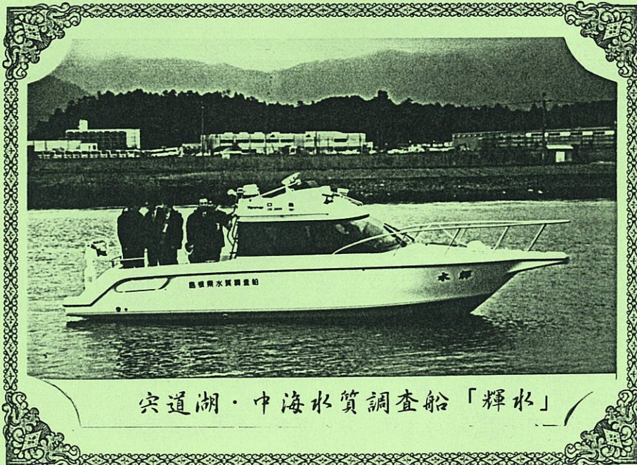
宍道湖・中海水質調査船「輝水」

島根県では、このたび、宍道湖・中海の水質調査船を新しく建造しました。そして、宍道湖・中海がさらに光り輝く地域の貴重な資産であり続けるよう「輝水」と命名しました。