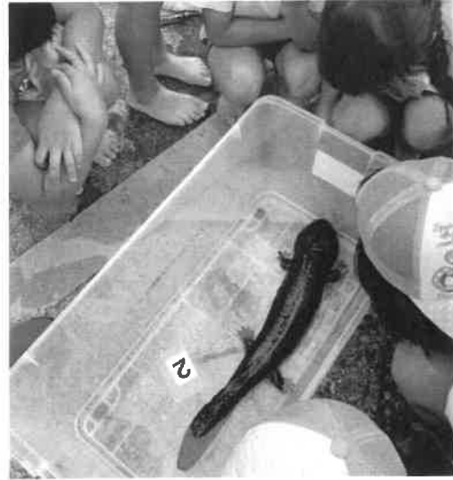
12月9日～ オオサンショウウオ交流会