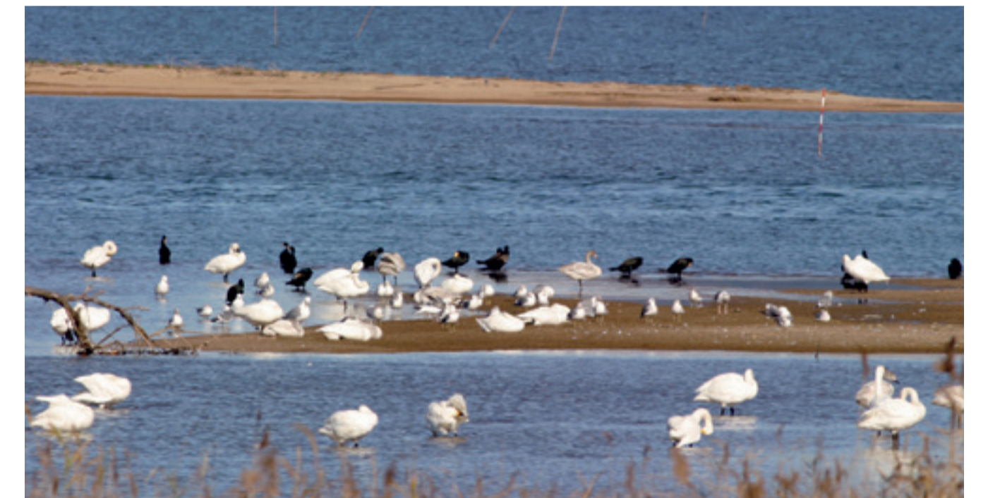
河口にはたくさんの野鳥が集まります