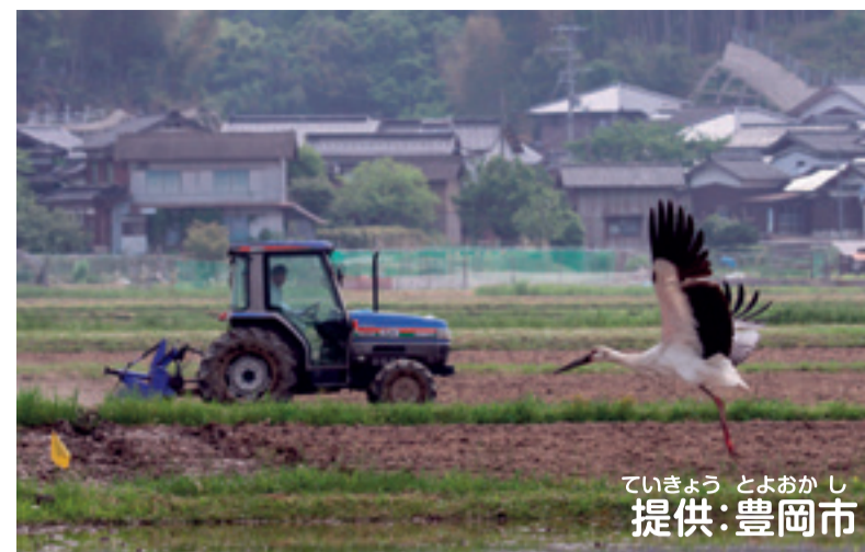
円山川下流域・周辺水田