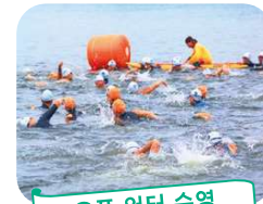
오픈 워터 수영