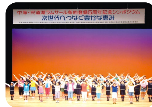
兒童環境劇場 「愛、地球與拍賣商」