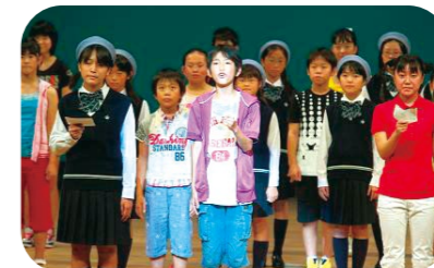
給未來中海・宍道湖的訊息