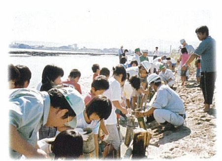
恢復濕地的自然生態環境