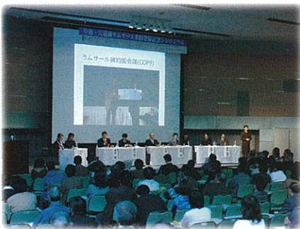
召開專題座談會提高民眾的關心度