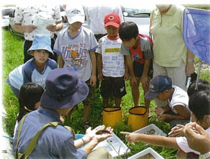
觀察自然接觸濕地的動植物