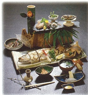
「商品」品牌化，提高商品價值(宍道湖七珍)