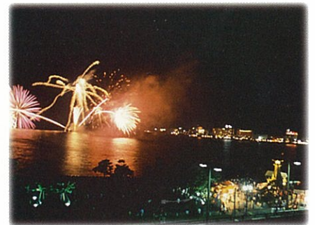
讓更多人享受宍道湖和中海的優美景緻(觀光)