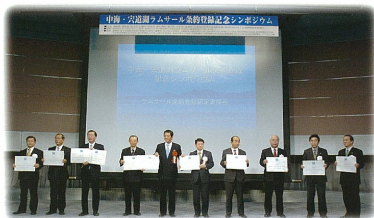
登記濕地專題座談會・認定証授與儀式

我們擁有這兩湖感到驕傲，不僅是現代的我們，未來的子子孫孫，將延續宍道湖和中海所賜的恩惠。