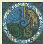
1999年 COP 7 哥斯大黎加·聖荷西