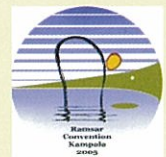
2005年 COP 9 非洲·烏干達

1993年在日本·釧路召開COP 5以後，當時COP的象徵標識早已完成，從變遷角度觀察“飛翔的水鳥”中，魚類和水草亦已被列為保護範圍。宍道湖·中海登記於COP 9，這時已無具體指定保護動植物名稱，至今強調“濕地與水，及周遭共存之動植物”。